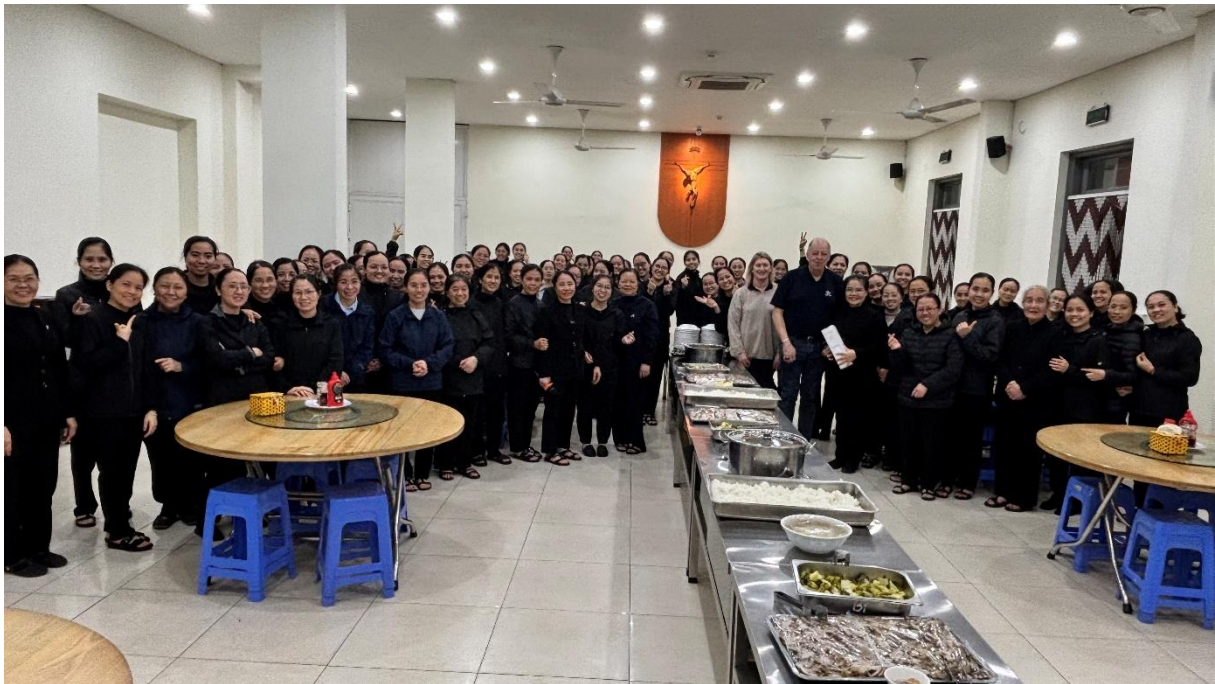
Repas avec la communauté de Sœurs Amantes de la Croix de Hanoi

Depuis 2023, l'archevêque du Diocèse de Hanoi promeut davantage l'évangélisation dans les paroisses de cette zone en demandant aux sœurs « Amantes de la Croix de Hanoi » de collaborer avec l'archidiocèse pour évangéliser dans cette zone. Mgr Joseph Vu Van Thien a permis à la Congrégation d'utiliser un terrain de 1.500 m 2 , situé au sein du futur centre paroissial de Muong Cat, pour construire un local et développer cette zone de mission.