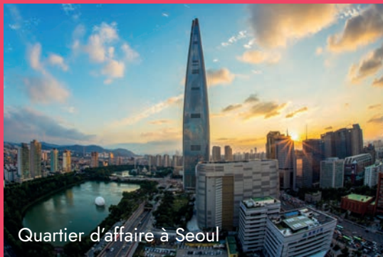
Quartier d'affaire à Seoul