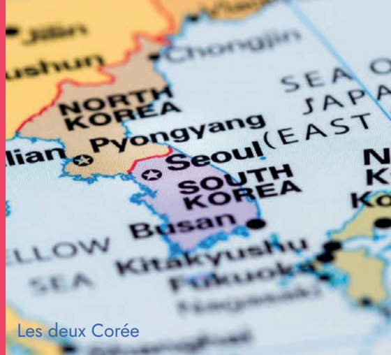
Les deux Corée