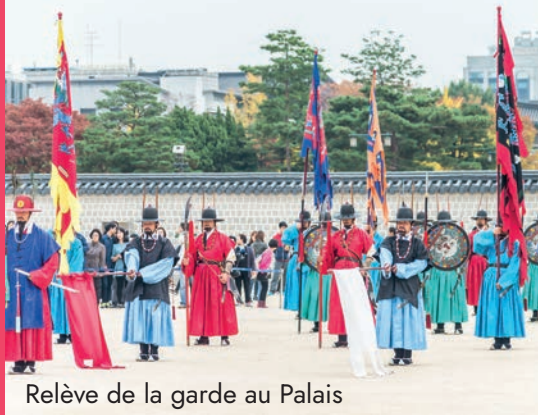
Relève de la garde au Palais