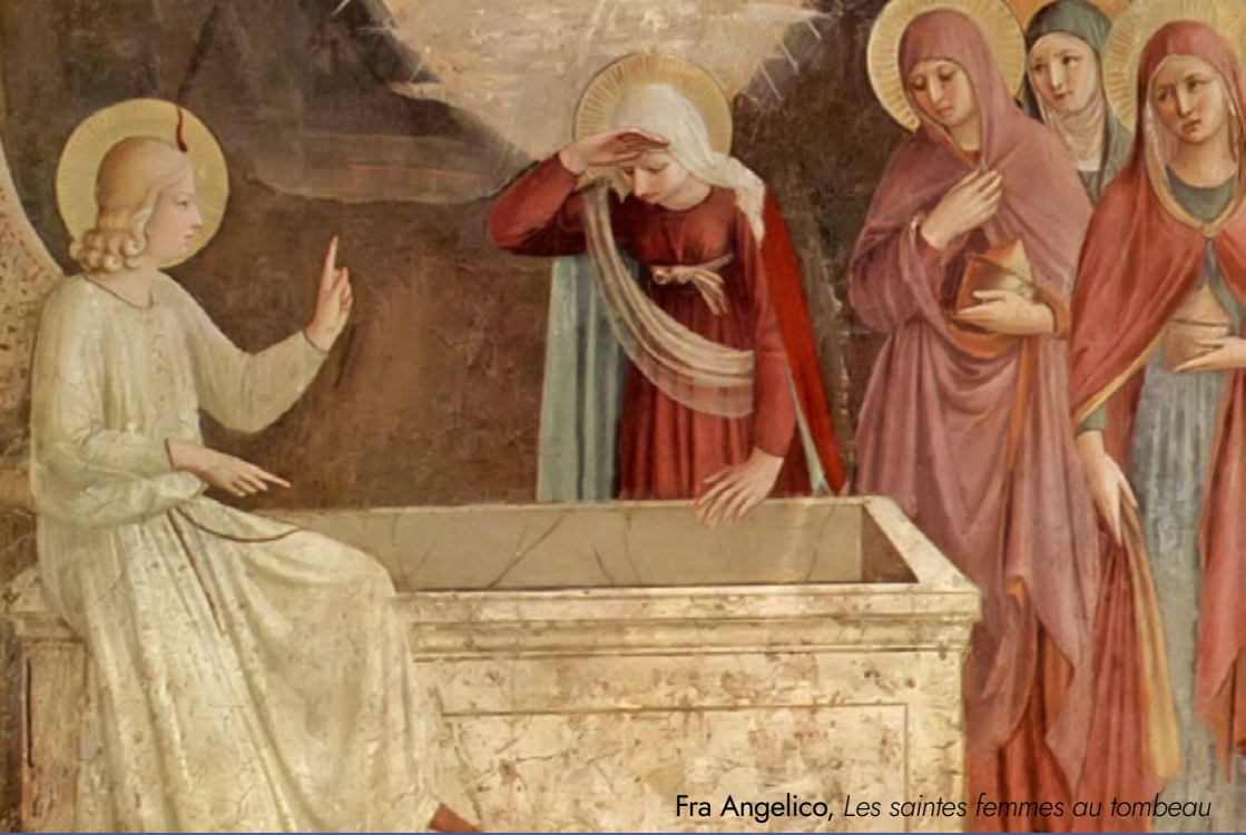
Fra Angelico, Les saintes femmes au tombeau

Marie Madeleine voit le tombeau ouvert mais elle ne va pas plus loin. Elle repart informer les autres pour qu'ils viennent voir ce qui se passe.