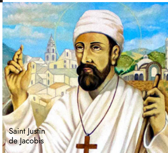
Saint Justin de Jacobis

Gebremichael est un moine orthodoxe qui, au cours d'un pèlerinage, a rencontré l'évêque italien Justin de Jacobis. Il fait connaissance avec ce saint missionnaire, se convertit au catholicisme et est ordonné prêtre. Avec St Justin, il évangélisera la région du Tigray dans le nord de l'Éthiopie. Tous deux sont malheureusement arrêtés. Gebremichael mourra enchaîné en martyr, et sera béatifié par le Pape Pie XI en 1926.